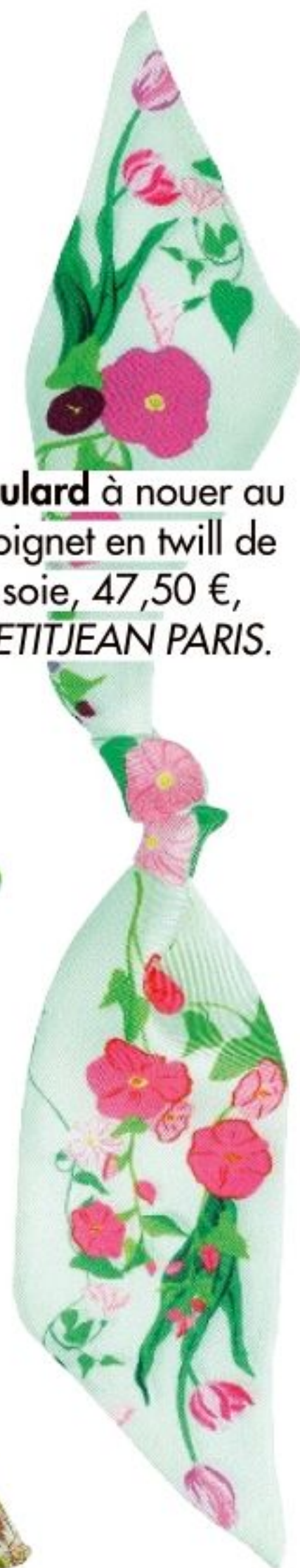
Foulard à nouer au poignet en twill de soie, 47,50 €, PETITJEAN PARIS.