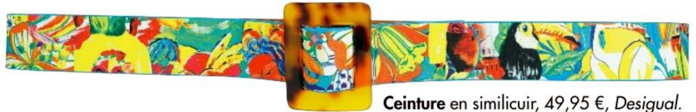
Ceinture en similicuir, 49,95 €, Desigual.

Des foulards et des chapeaux plein la tête