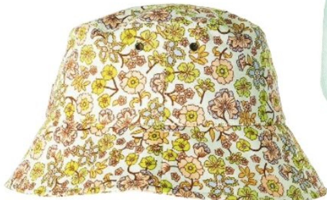
Bob en coton, 59,95 €, SCOTCH & SODA.