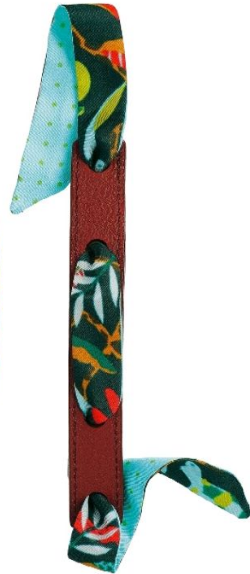
Bracelet foulard en cuir et twill de soie, 67 €, Malfroy.