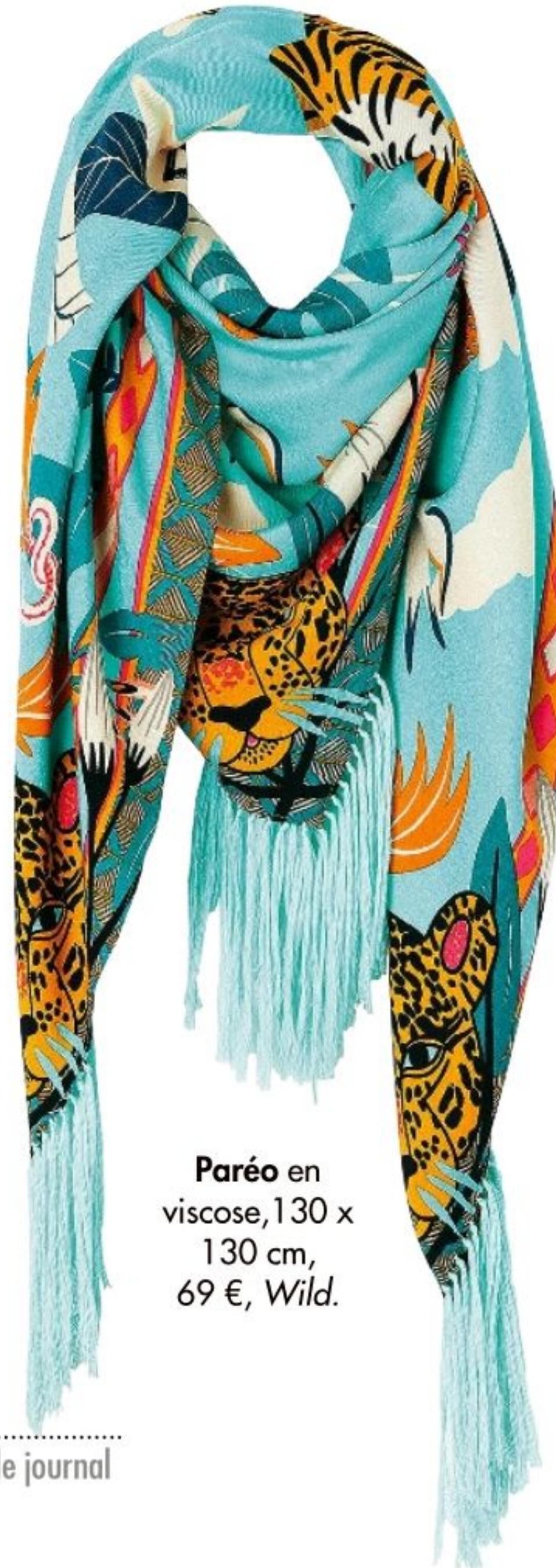
Paréo en viscose, 130 x 130 cm, 69 €, Wild.