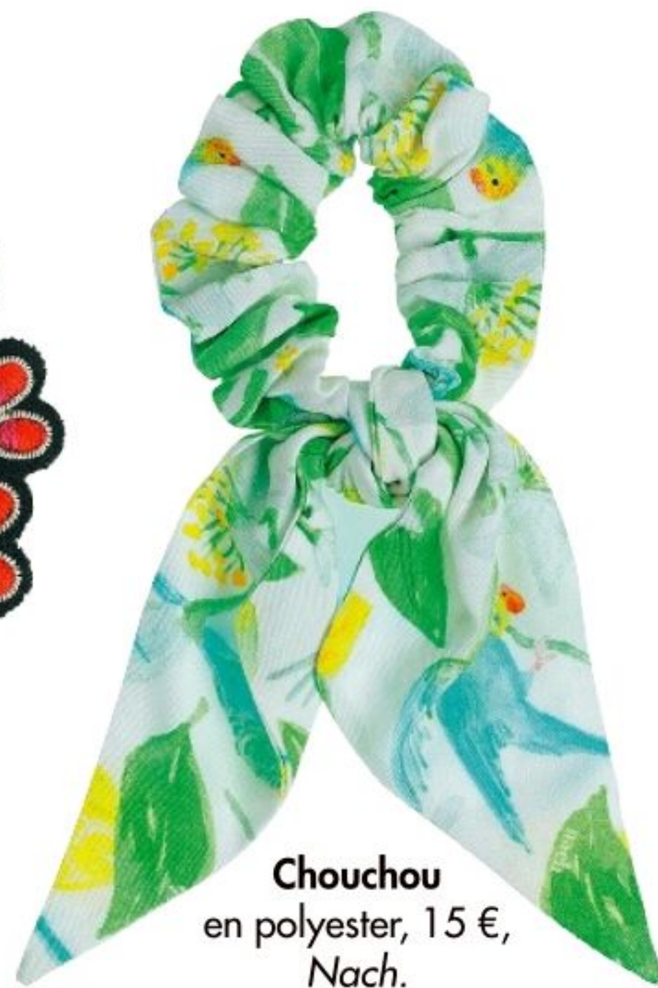
Chouchou en polyester, 15 €, Nach.