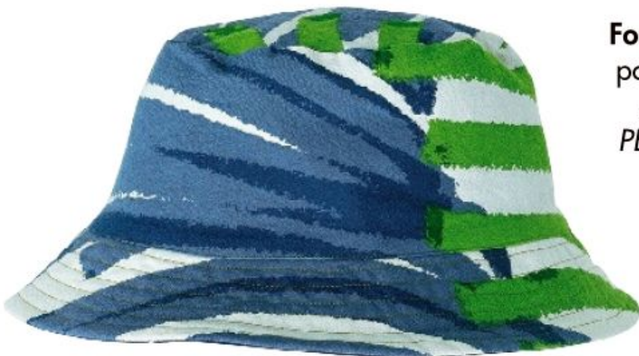
Bob en coton, 49 €, Mapoésie.

Des foulards et des chapeaux plein la tête