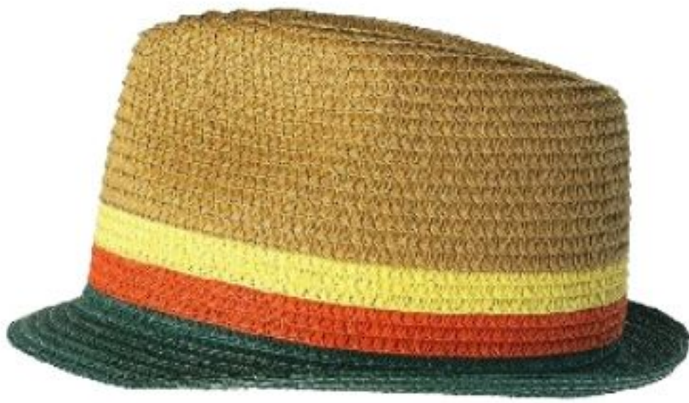
Chapeau en paille, 7 €, Kiabi.