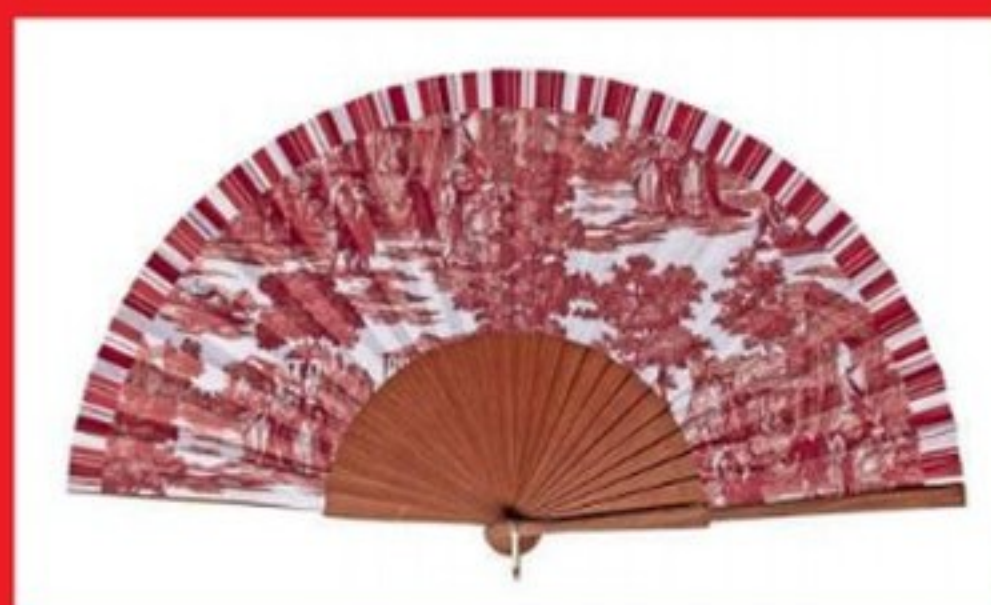
Éventail, Kausi , 44 €. kausi.es