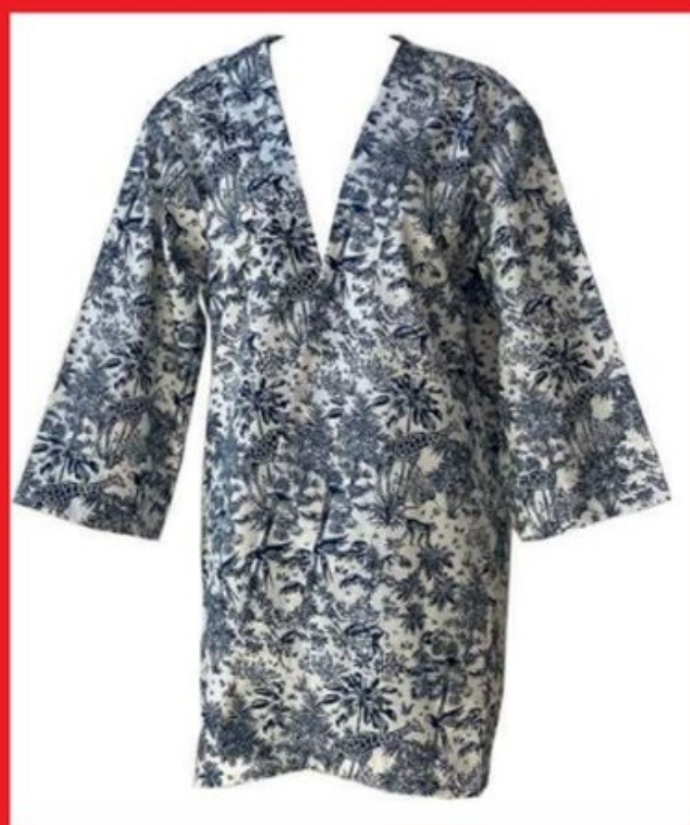
Kimono, Evesome , 110 €. evesome.com

Depuis plus de 250 ans, la toile de Jouy reste un grand classique de l'art décoratif. Chargée d'histoire, cette étoffe au charme suranné, vivifiée et modernisée par la Maison Dior, est absolument partout cette année. Star des podiums, elle descend dans nos quotidiens et nous fait du bien. De collection en collection, la toile de Jouy est plus que jamais là et c'est l'incontournable de cette saison.