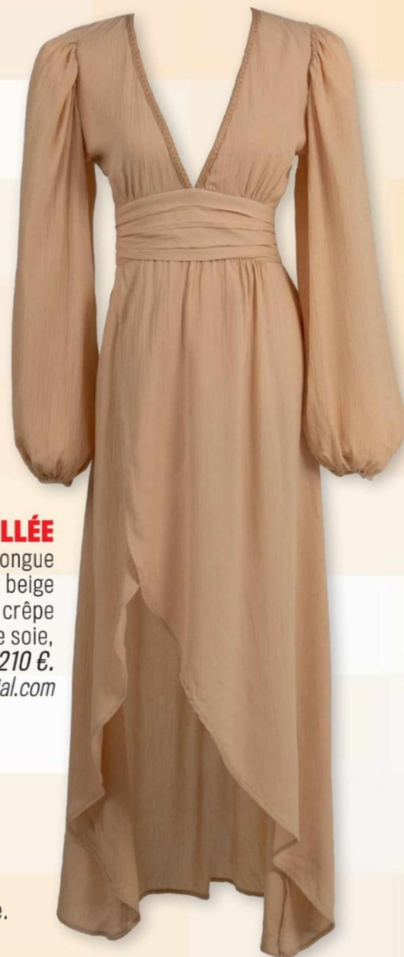
HABILLÉE Robe longue Noor beige poudré en crêpe de soie, Bahaar , 210 €. bahaarofficial.com