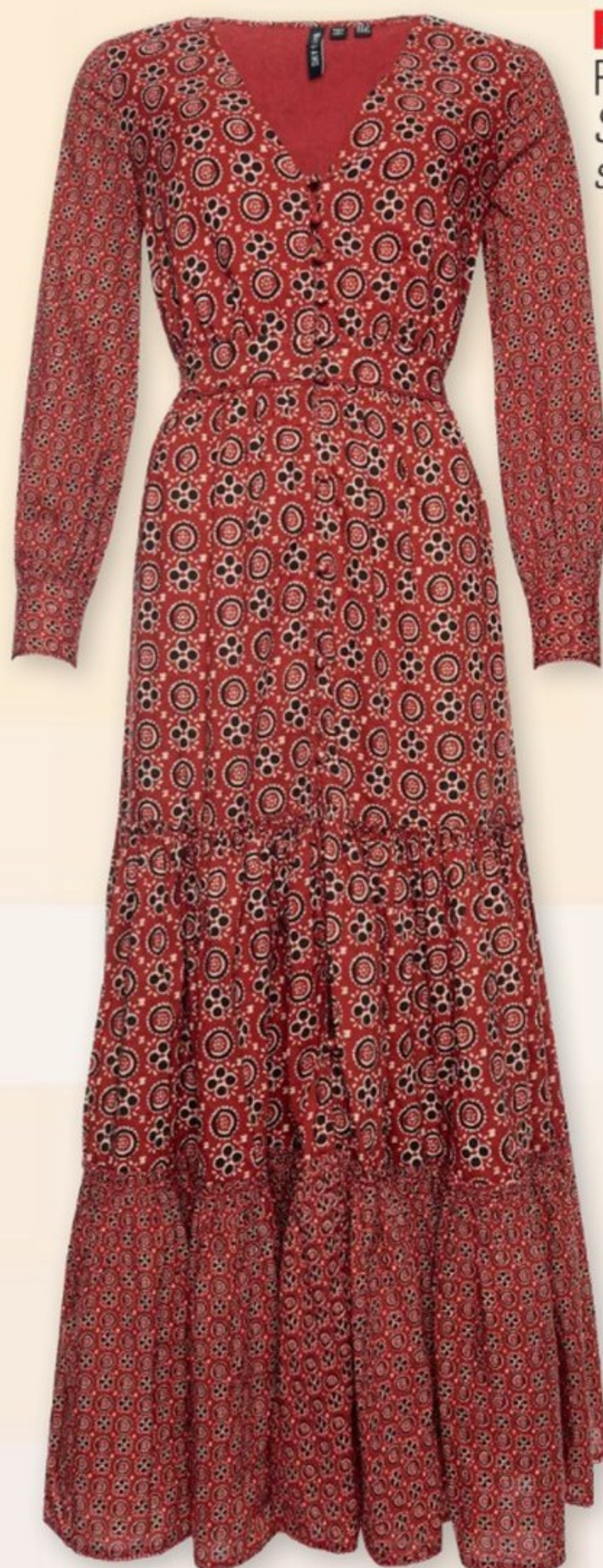
RÉVOLUTION Robe rouge en viscose. Superdry , 99,99 €. superdry.fr