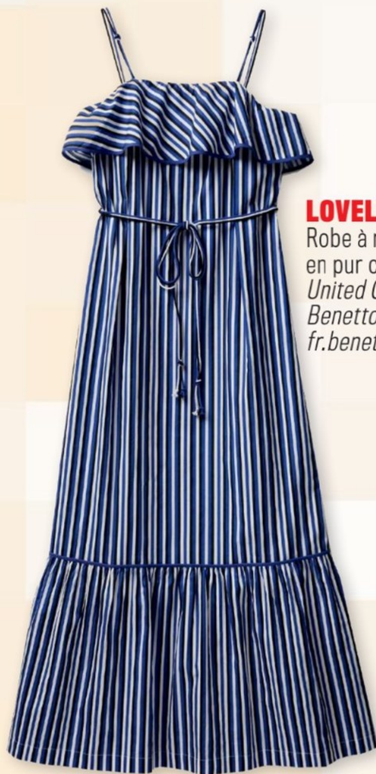
LOVELY Robe à rayures en pur coton. United Colors of Benetton , 89,95 €. fr.benetton.com