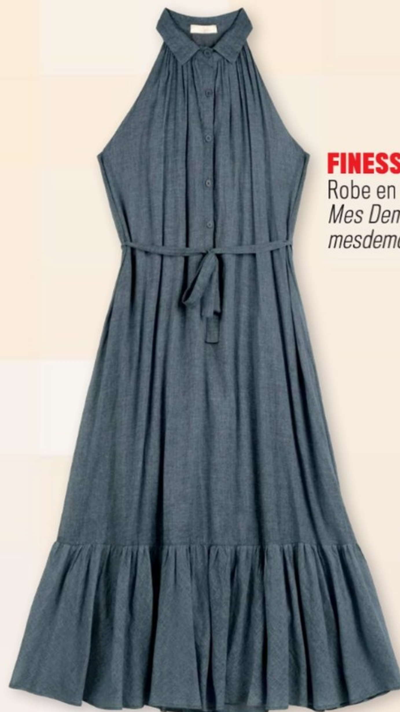
FINESSE Robe en voile de coton. Mes Demoiselles , 235 €. mesdemoisellesparis.com