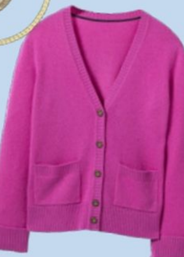
Gilet en cachemire, Boden, 240€.