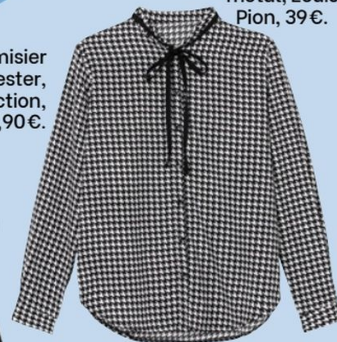
Chemisier en polyester, U Collection, 22,90€.