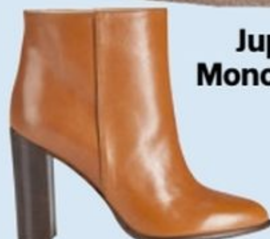
Boots en cuir, Madeleine, 285,95€.