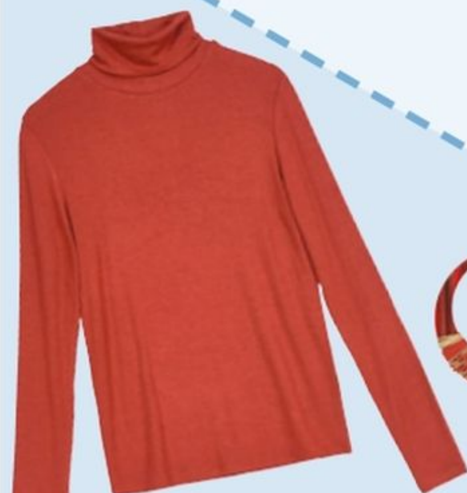
Sous-pull en viscose mélangée, Lili Sidonio, 30€.