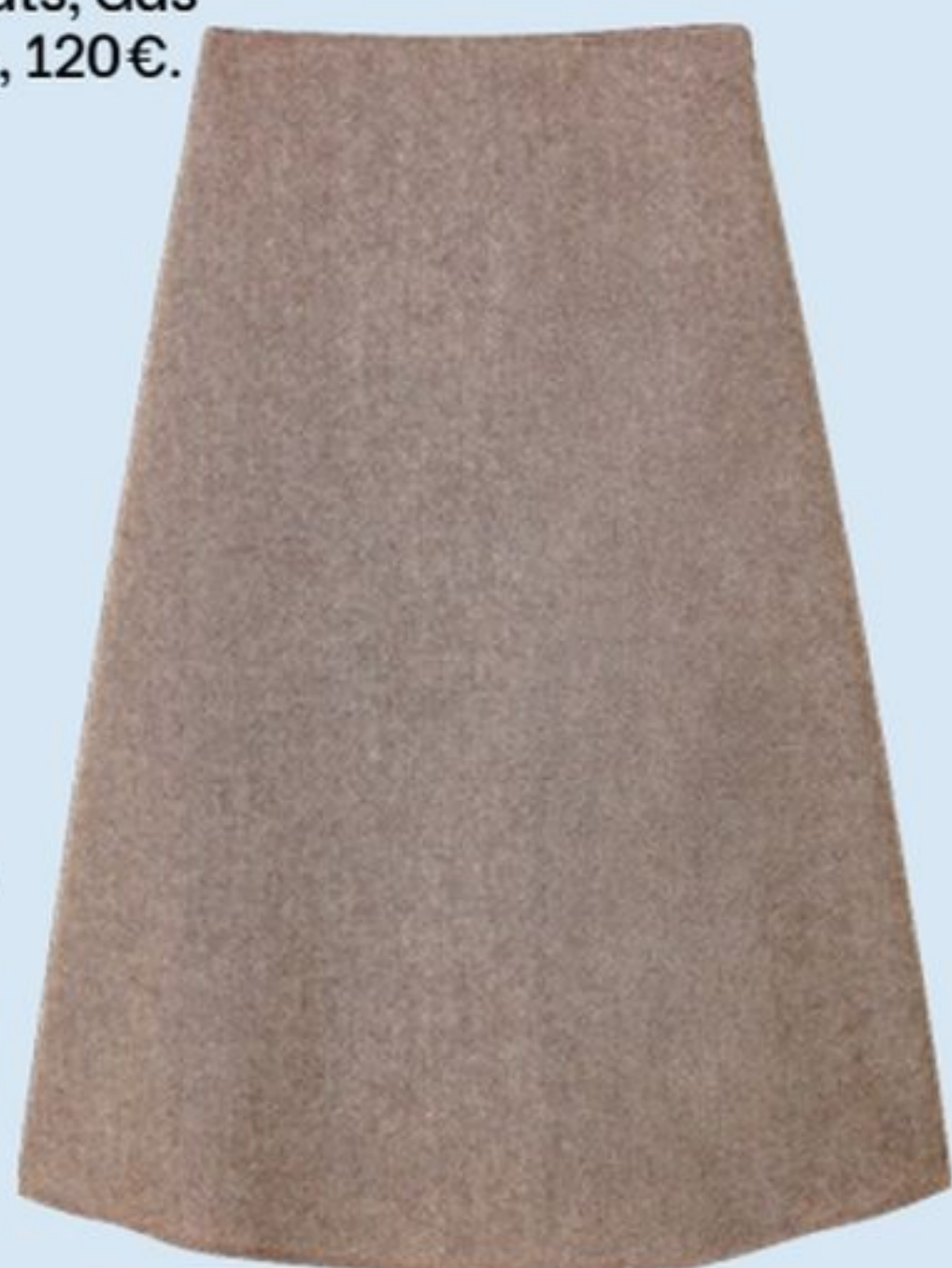
Jupe en viscose, Monoprix, 45,99€.