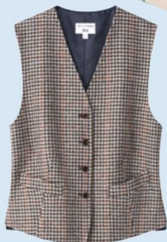
Gilet en laine mélangée, Ines de la Fressange x Uniqlo, 59,90€.