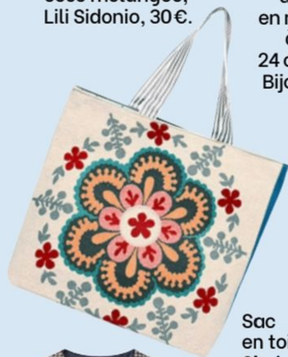
Sac en toile, Shein, 3,50€.