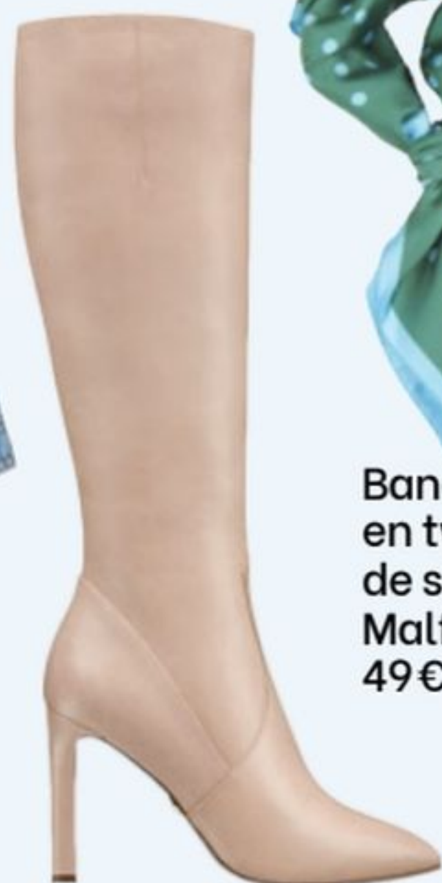
Bottes en cuir, Tamaris, 180€.