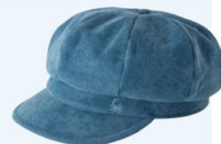
Casquette en velours, United Colors of Benetton, 25,95€.