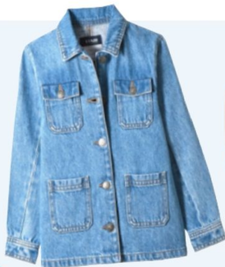
Veste en jean, Kiabi, 20€.