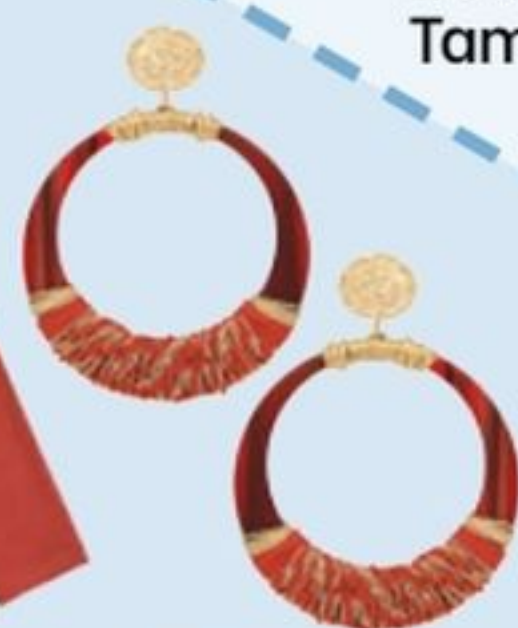
Boucles d'oreilles en métal doré à l'or fin 24 carats, Gas Bijoux, 120€.