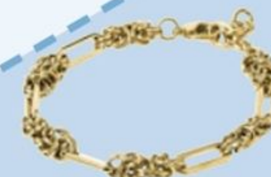
Bracelet en métal, Louis Pion, 39€.