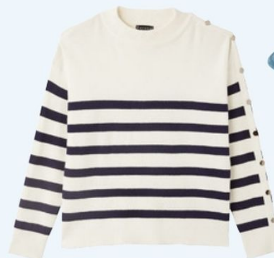
Pull en coton mélangé, Balsamik, 44,99€.