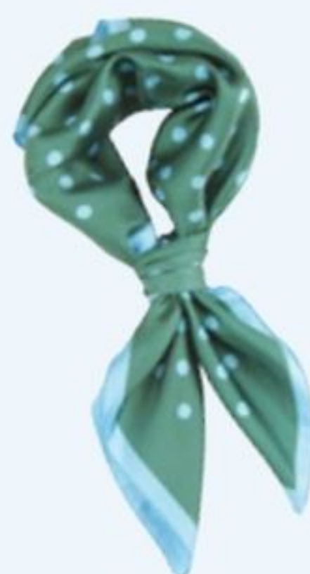
Bandana en twill de soie, Malfroy, 49€.