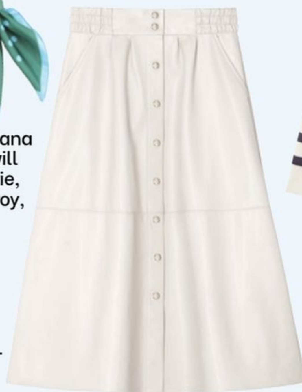
Jupe en polyuréthane, Morgan, 60€.