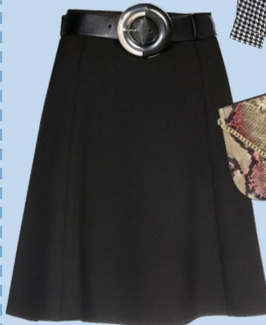
Jupe ceinturée en polyester et viscose, Caroline Biss, 140€.