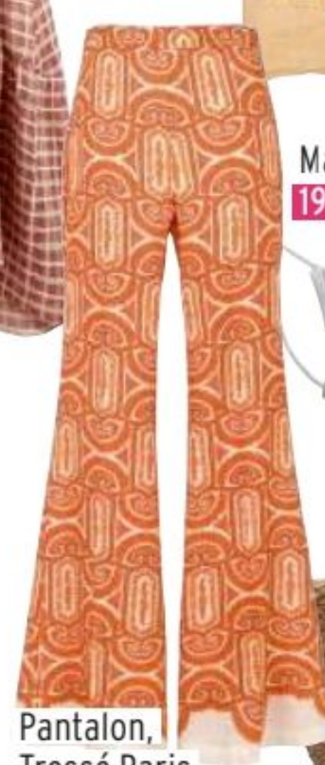
Pantalon, Tressé Paris 175€