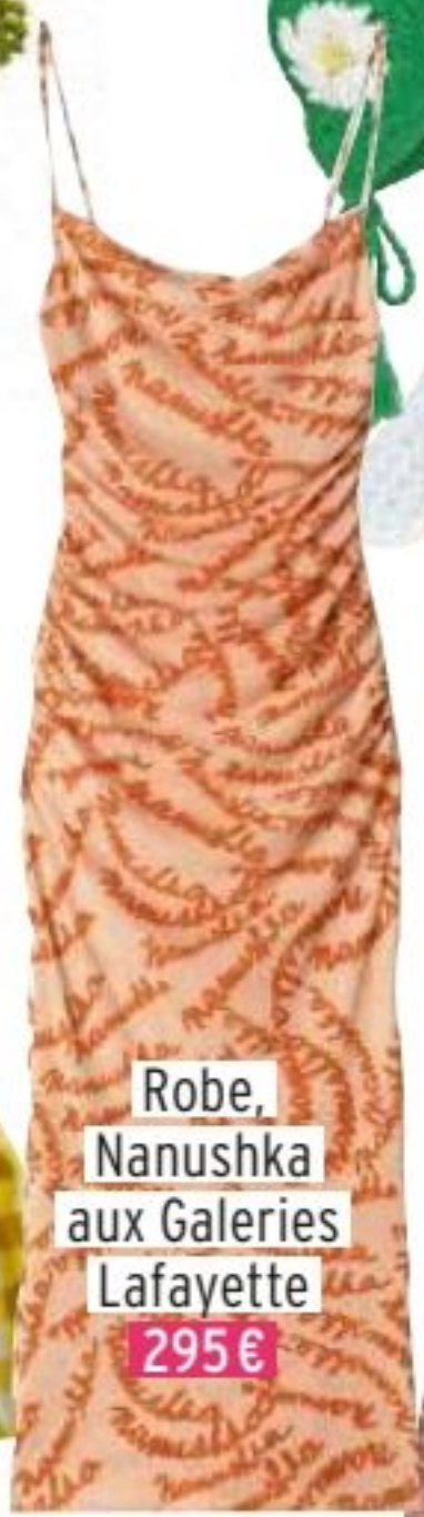
Robe, Nanushka aux Galeries Lafayette 295€