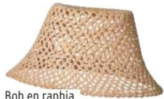
Bob en raphia, Galeries Lafayette 50€