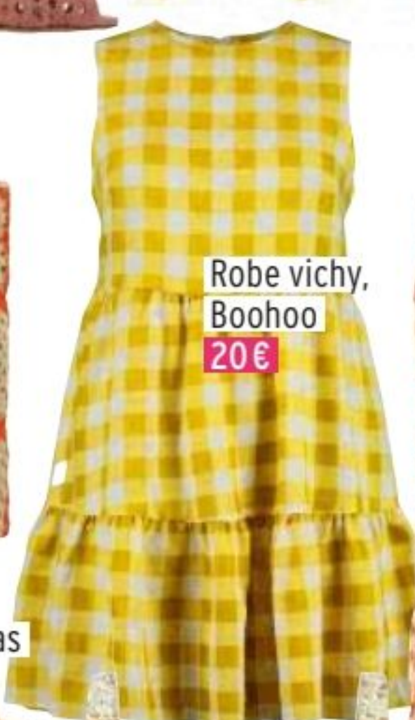
Robe vichy, Boohoo 20€