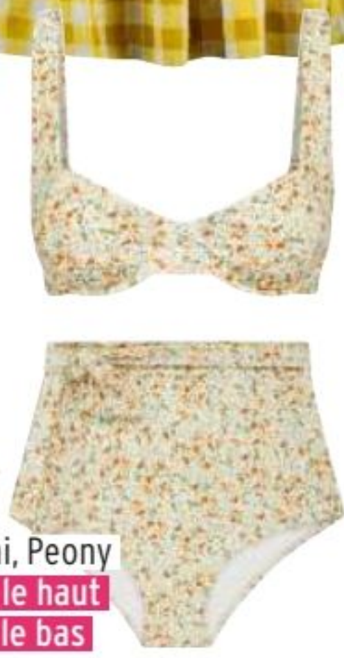
Bikini, Peony 95€ le haut 97€ le bas