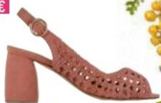
Escarpins tressés, Bobbies 195€