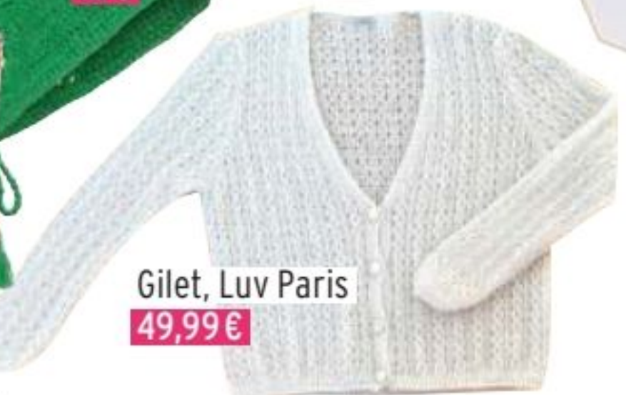
Gilet, Luv Paris 49,99€