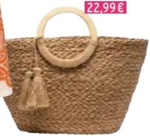
Panier, Gémô 22,99€