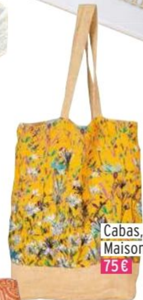
Cabas, Maison Casablanca 75€