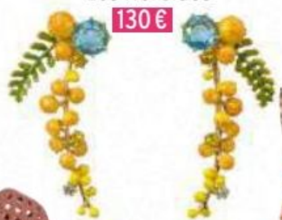
Boucles d'oreilles, Les Néréides 130€