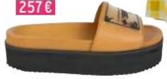
Mules, Victoria/Tomas 257€