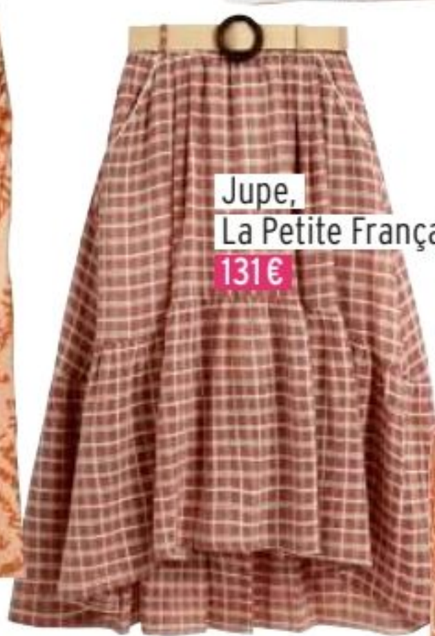
Jupe, La Petite Française 131€